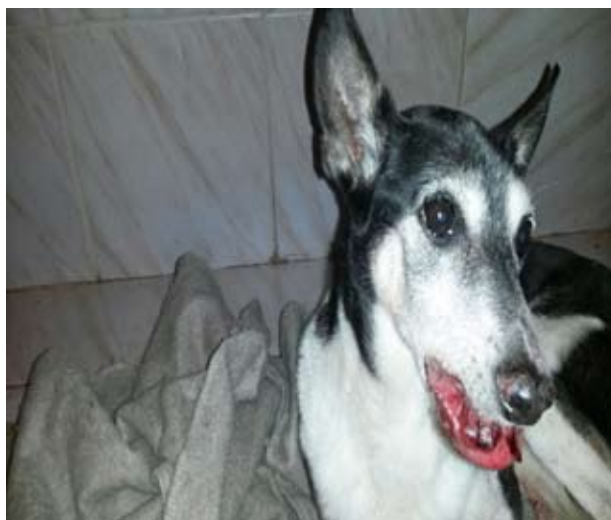
Figura 1: paciente antes de iniciar o tratamento. Observa-se massa volumosa e sangrenta.

de látex de janaúba ( Himatanthus drasticus ), 36 gotas diluídas em 1L de água filtrada qid/30 dias, após as refeições, reduzidos a tid/10 dias subsequentes. As lesões foram reduzindo, após 30 dias de tratamento desapareceram e a mucosa repigmentou (Figura 2).