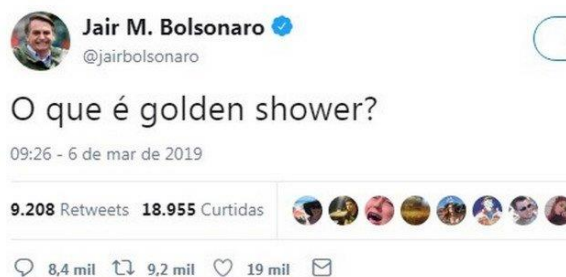
Fig. 3 - Reprodução de captura de tela/ Print no aplicativo Twitter de texto do então presidente Jair Bolsonaro

Fonte: Captura de tela da conta de twitter do Presidente Jair Bolsonaro 7