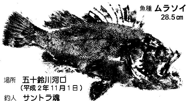
Fig. 1 - Gyotaku . Cartaz de peixe impresso para venda na cidade de Enoshima, Japão.

Esse jogo aciona com eficácia a equivalência entre coisa e imagem. Trata-se de uma disposição imagética ancorada em um lugar de referência compartilhado com a comunidade que vê no Gyotaku uma publicidade sem exageros nem hipérboles, elementos, diga-se de passagem, entranhados no visual publicitário ocidental.