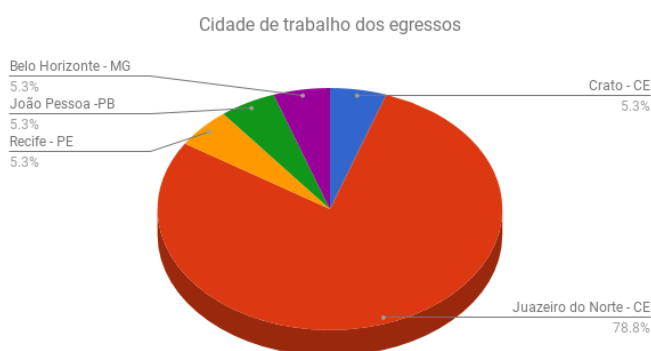
Gráfico 2: Cidade de trabalho dos egressos da UFCA

Identificamos que existem dois períodos de colação de grau (fevereiro e julho), e que a UFCA possui, no curso de Jornalismo, apenas um ingresso anual (janeiro) por meio do Sistema de Seleção Unificada (Sisu) 8 . O estudante pode ser de uma turma anterior ao ano de ingresso e colar grau em turma posterior. A maioria dos respondentes (28,9%) era pertencente à primeira turma formada pelo Curso, seguidos pela segunda (23,8%), quarta (23,8%), quinta (14,3%) e terceira turma (9,5%). Em relação à terceira parte, tratamos da atuação profissional do egresso, com a elaboração de duas algumas perguntas (sendo que a segunda estava condicionada à resposta da primeira): “Trabalha atualmente? Local ou cidade de trabalho?”.